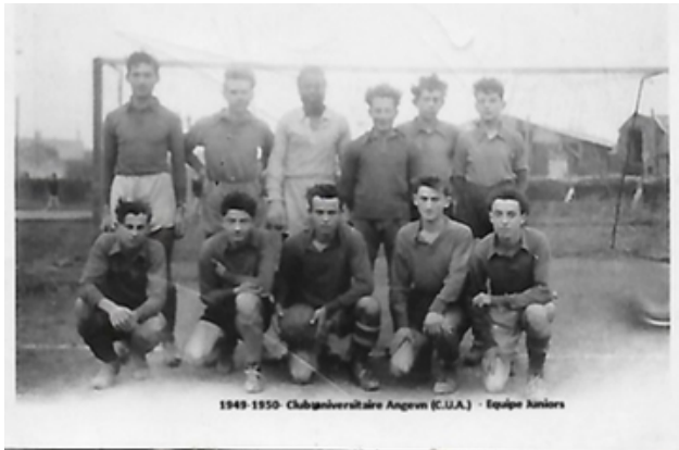
Saison 1949-1950 : l'équipe juniors du C.U.A.

Au début du 20ème siècle, le second stade de l'Angers Université Club (A.U.C.), se trouvait à l'angle des actuelles rue des Camélias et rue des Mimosas. Son premier terrain pouvait se situer vraisemblablement de l'autre côté de la route de Paris, au lieudit Le Grand-Chaumineau. Un autre terrain a existé au lieudit Grand-Malmouche, à l'arrière du magasin Leroy-Merlin et presque en face du terrain actuel de l'Arceau. Le Club Sportif Jean-Jaurès y a joué à l'époque. En 1923, selon les photos de l'I.G.N., il n'y avait aucune trace de terrain de sport à l'angle des chemins des Banchais et des Deux-Croix, emplacement du futur stade du C.U.A.